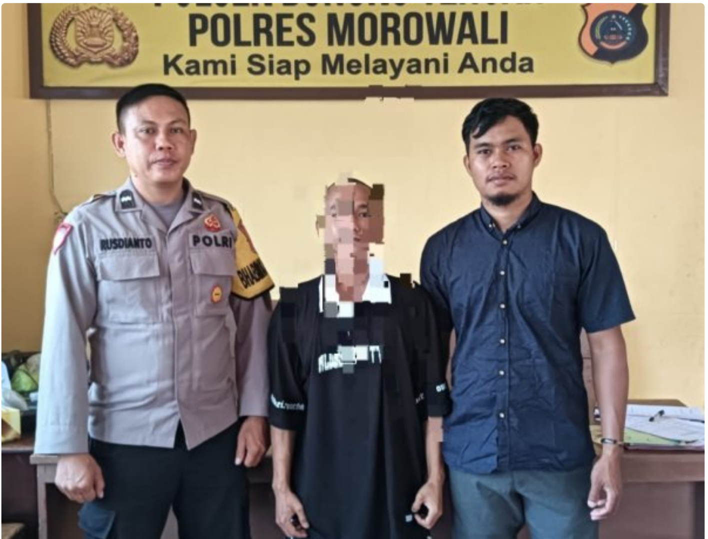
Aparat Polsek Bungku Tengah Berhasil Tangkap Pelaku Curanmor

MOROWALI, Sulawesi Tengah- Pada Hari Sabtu 5 Oktober 2024 Sekitar Pukul 18.30 Wita Kepolisian Sektor (Polsek) Bungku Tengah Polres Morowali, berhasil